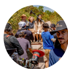
CULTURA EM ...