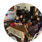
CULTURA EM ...