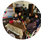
CULTURA EM ...