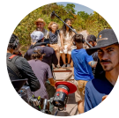
CULTURA EM ...