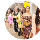
CULTURA EM ...