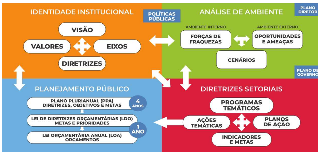
Figura 1: Construção Metodológica – PPA 2026-2029

A elaboração do PPA fora concebida nas seguintes etapas: