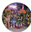
CULTURA EM ...