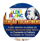
CULTURA EM ...