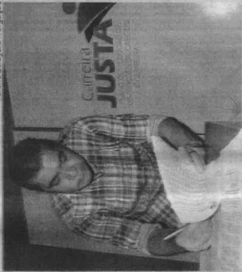
Amastha também lançou novo projeto