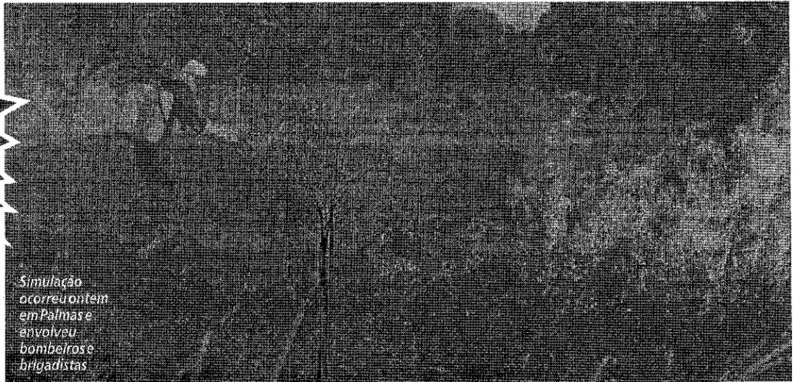
Simulação ocorreu ontem em Palmas e envolveu bombeiros e brigadistas