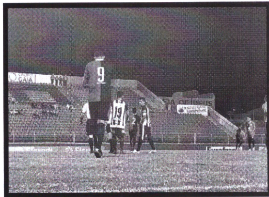
Time foi desclassificado da Copa São Paulo após três derrotas