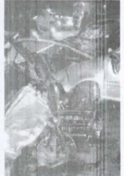
Veículo ficou destruído após acidente com animais

Batida com cavalos tira motor de carro e fere pessoas P10