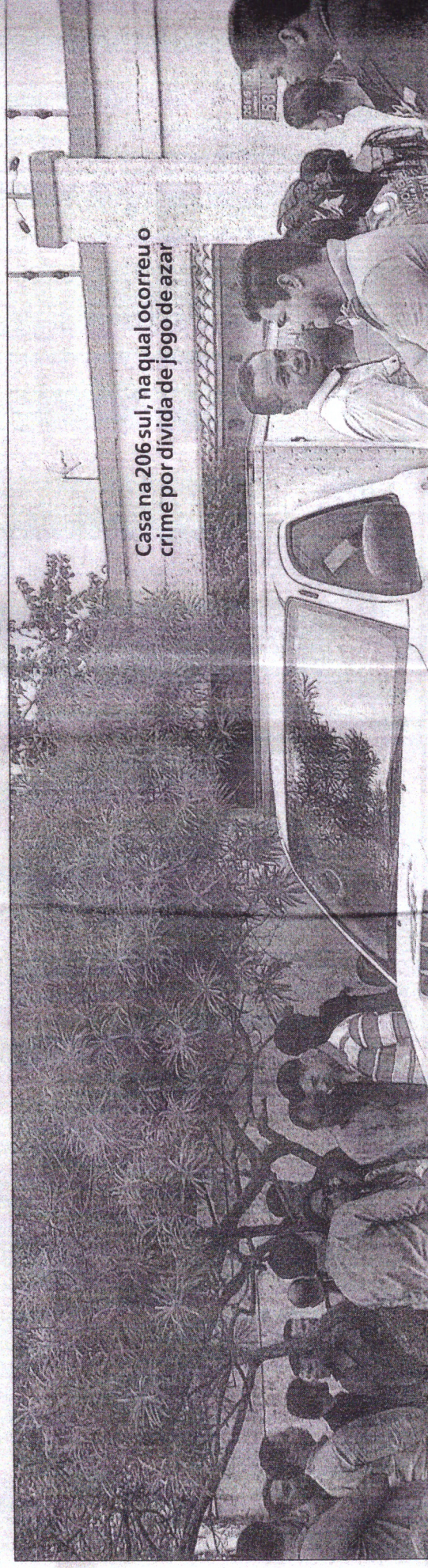
Casa na 206 sul, na qual ocorreu o crime por dívida de jogo de azar